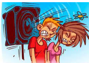
Bruits d'activité provenant de commerces, activités industrielles, manifestations sportives ou culturelles, etc ...